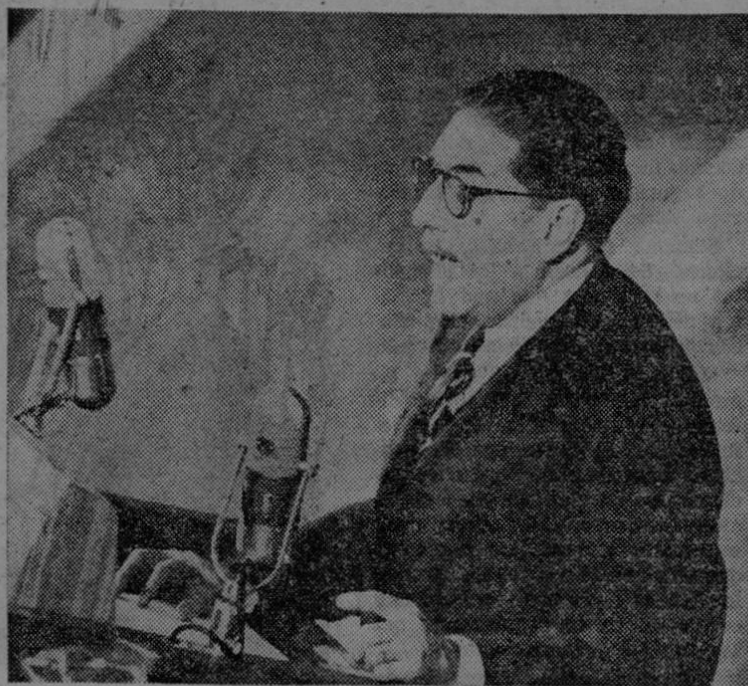
Licenciado Luis Padilla Nervo, Secretario de Relaciones de México, pronunciando su discurso en la Asamblea General de la O. N. U. en la ciudad de San Francisco, California.

Esta capacidad de escoger entre la creación y la destrucción es una de las pruebas de su libertad fundamental. Seamos fieles a lo que un día escogimos como lo mejor y más valioso: la independencia de los pueblos y la autonomía de la conciencia individual. La paz brotará de esa fidelidad y permitirá la continuidad de nuestra historia.