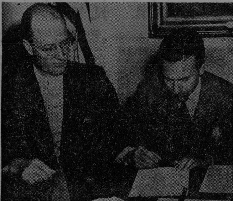
Los Estados Unidos y la República Argentina concertaron un acuerdo para la utilización pacífica de la fuerza nuclear, que se desarrollará en el terreno de la más amplia cooperación. El embajador argentino en Washington, Hipólito Jesús Paz, a la derecha, firma el documento, mientras observa Henry F. Holland, secretario de Estado adjunto encargado de Asuntos Interamericanos de Estados Unidos.