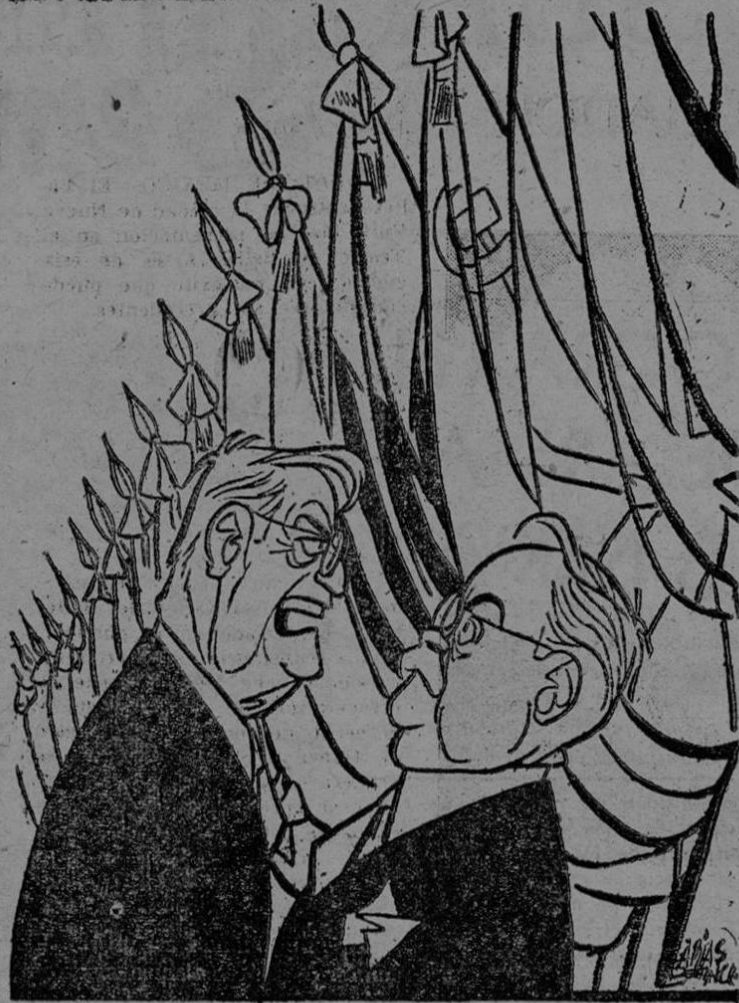
MOLOTOV.—Para la paz son necesarios siete puntos... DULLES.—Sí: los puntos sobre las "ies"...